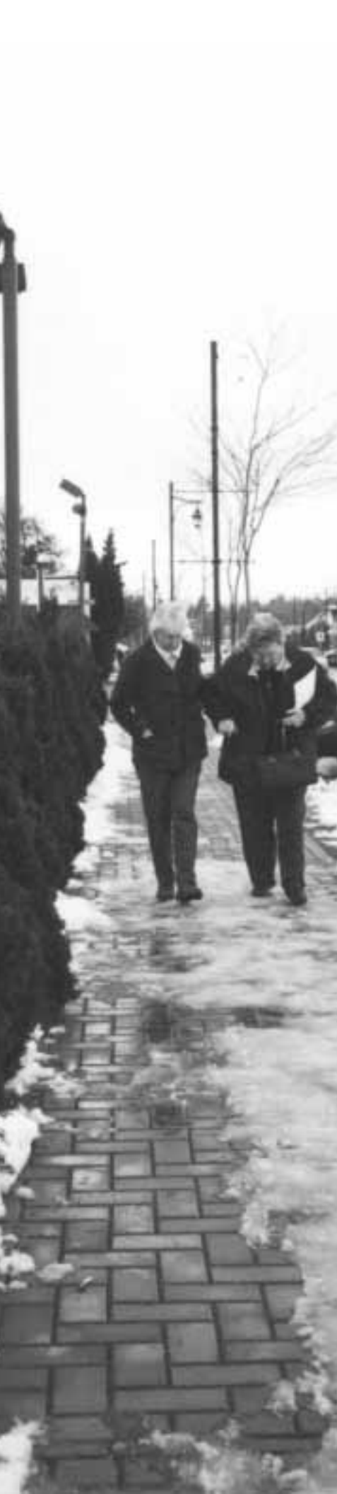
FIGURE 2 : EXEMPLES DE LIEUX OÙ LA SÉCURITÉ EST UNE PRÉOCCUPATION